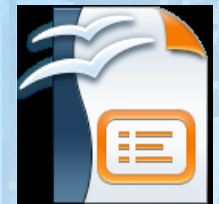
Impress archivo. odp