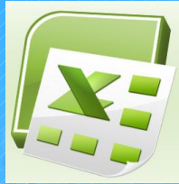
Excel archivo. xls