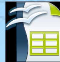
Calc archivo. ods