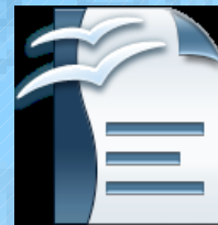
Writer archivo. odt